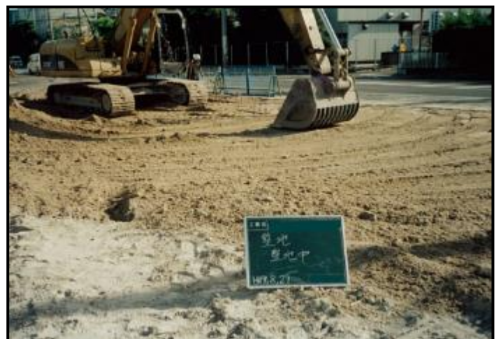
・整地（重機等で土砂を均していることが確認できる）