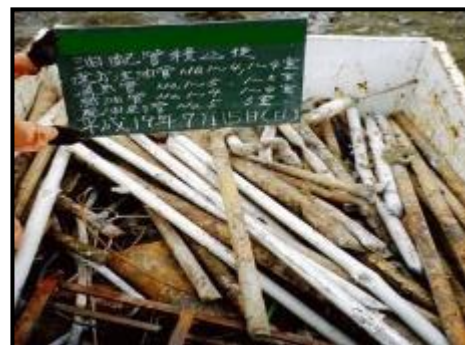
* 運搬車両に配管を積込した写真