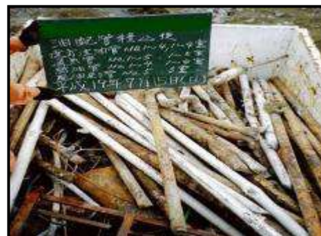
* 運搬車両に配管を積込した写真