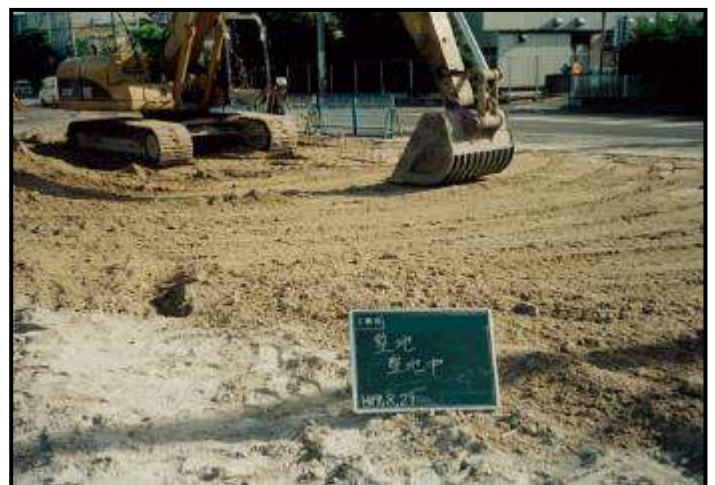
・整地（重機等で土砂を均していることが確認できる）