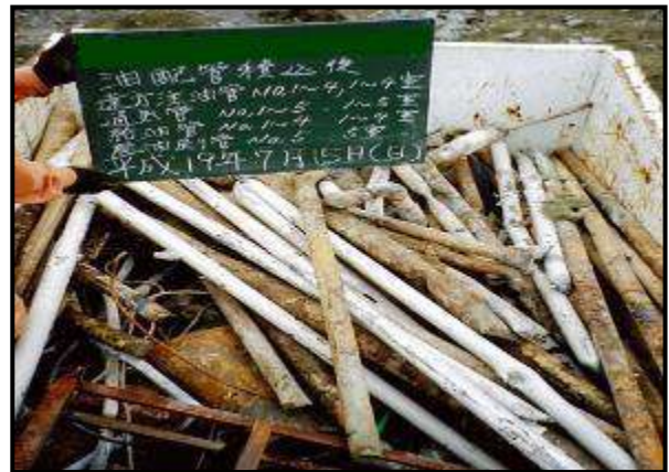
* 運搬車両に配管を積込した写真